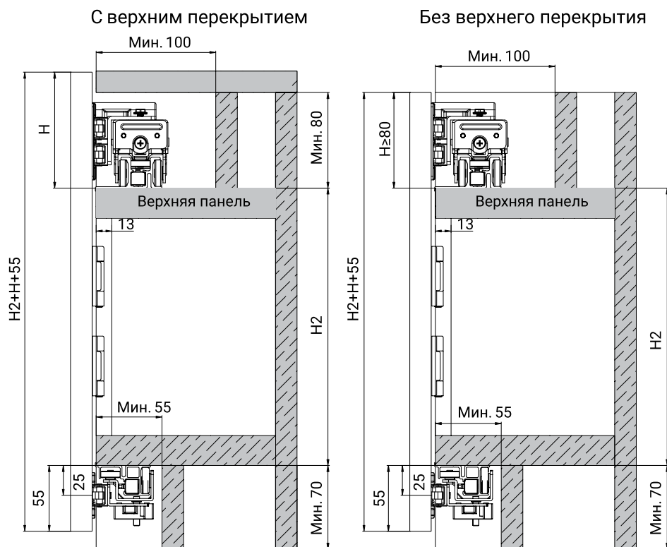
Схема установки для складной-сдвижной системы MODUS T902